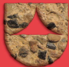
design @ atelier-do-ver